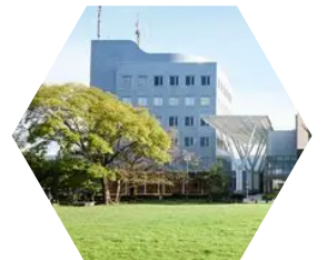
ビエント高崎 エクセルホール